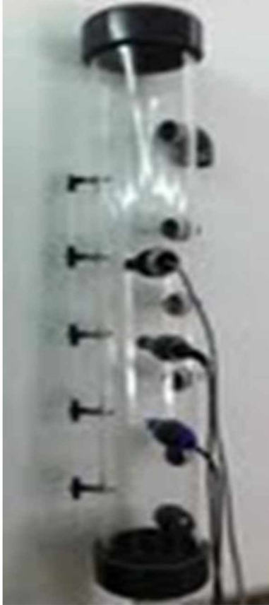
Şeffaf malzemedan üretilmiş sensör sistemi

Bu sistemler sadece örnek olup, genelgede anlatılmakta olan yukarı akışlı sensör sistemi konusunda fikir oluşturmak amacıyla verilmiştir.