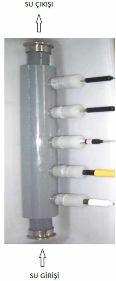
Paslanmaz çelik malzemedan üretilmiş sensör sistemi